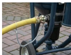
Exemplo de whip check

Para instalação de linhas rígidas temporárias (chicksan) deve ser disponibilizado e utilizado sistema de retenção tipo safety slings, flow line safety restraints ou outro sistema equivalente que atenda essa finalidade.