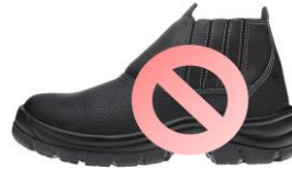
Botina de segurança (cano curto)