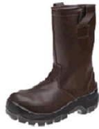
Bota tipo petroleira