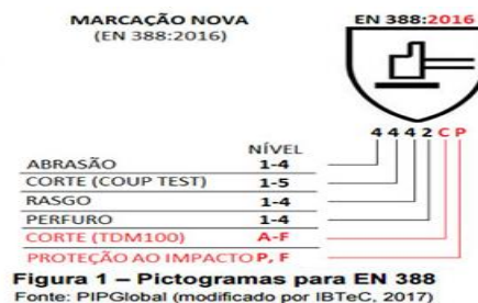
Figura 1 – Pictogramas para EN 388

Visando a melhoria de proteção das mãos devem ser utilizadas luvas com nível de proteção mínima "2" para corte. Os níveis de proteção requeridos por atividades desempenhadas na sonda deverão ser analisados e estabelecidos pelas empresas.