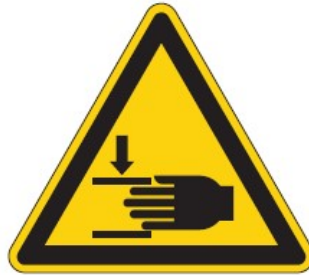
Risco de esmagamento das mãos (ISO 7010)